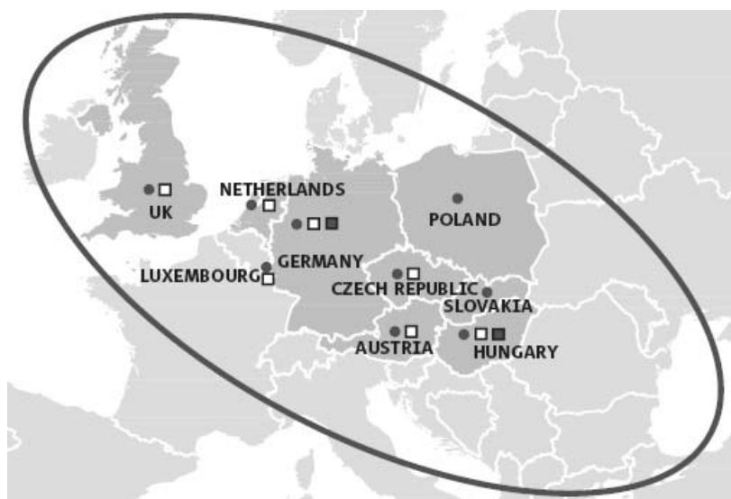
Rys. 8. Zasięg rynku koncernu RWE