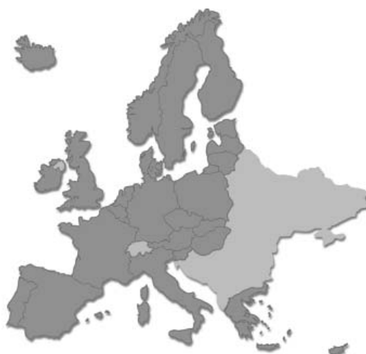
Rys. 3. Kraje CEER

z wymienionych grup funkcjonowały także w strukturze ERGEG, trzecią zaś była Grupa Robocza ds. Ochrony Konsumentów. Do zadań grup tematycznie związanych z rynkiem energii elektrycznej należy w szczególności m.in. wspieranie dalszej integracji rynków w ramach inicjatyw regionalnych, wdrożenie Rozporządzenia 1228/2003 w sprawie handlu transgranicznego, w tym odnośnie wytycznych dotyczących kompensat międzyoperator- skich oraz harmonizacji taryf przesyłowych, opracowywanie wytycznych w sprawie warunków dostępu do sieci i zarządzania ograniczeniami w wymianie transgranicznej, a także standardów bezpieczeństwa, niezawodności pracy systemów przesyłowych oraz jakości energii elektrycznej (Aktualności 1/2007).