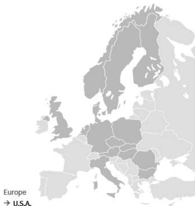
Rys. 7. Zasięg rynku koncernu E.ON