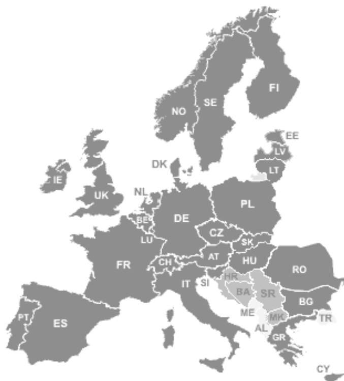
Rys. 2. Kraje ETSO

eksploatacji sieci przesyłowych w celu zachowania bezpieczeństwa pracy systemów przesyłowych oraz dostaw energii elektrycznej, a także analiza problemów o znaczeniu ogólnoeuropejskim dla branży OSP. Jednym z istotnych celów ETSO jest sfinalizowanie prac nad najważniejszymi problemami dotyczącymi płynności wspólnego, europejskiego rynku energii elektrycznej, do których należą kwestie dostępu do sieci i opłat w międzysystemowej wymianie energii elektrycznej oraz zarządzania ograniczeniami zdolności przesyłowych. Proponowane rozwiązania ETSO są weryfikowane podczas regularnych spotkań w ramach Europejskiego Forum Regulatorów Elektroenergetyki (tzw. Forum Florenckie), którego celem jest wspieranie działań prowadzących do utworzenia europejskiego rynku energii elektrycznej z intensywnie rozwijającym się handlem transgranicznym. Charakter i zakres funkcji pełnionych aktualnie przez Związek ETSO predysponują go w przyszłości (wraz z postępem procesu liberalizacji) do przejścia roli operatora systemu przesyłowego ogólnoeuropejskiego rynku energii elektrycznej.