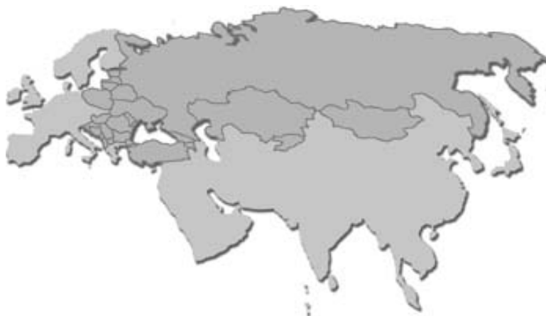
Rys. 4. Kraje ERA