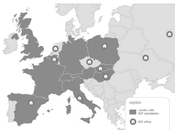
Rys. 6. Zasięg rynku koncernu EdF

roku ubiegłego (Thomas 2007). Koncern EdF wynik ten osiągnął przede wszystkim na rynkach Francji, Wielkiej Brytanii, Niemiec, Włoch i (w mniejszym stopniu) Hiszpanii (rys. 6). Na rodzimym rynku posiada zdolności wytwórcze o mocy 100,0 GW i dostarcza energię elektryczną do 27,0 mln odbiorców końcowych. Równocześnie korzysta on z ochrony wynikającej ze stosunkowo wolnego wdrażania przez władze francuskie konkurencji w sektorze energetycznym. W skali międzynarodowej EdF ma udziały w przedsiębiorstwach elektroenergetycznych i gazowych, posiadających źródła wytwórcze o mocy 20,0 GW i obsługujących 15,0 mln odbiorców końcowych. Przedsiębiorstwa te znajdują się w Europie, Afryce, obu Amerykach i na Bliskim Wschodzie (Monitor Ekonomiczny, 10 czerwca 2006).