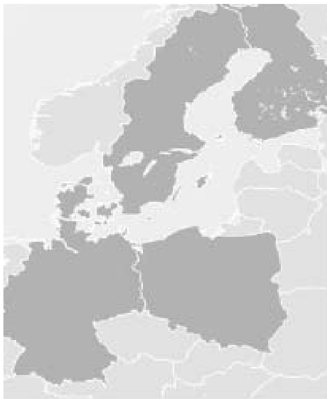
Rys. 9. Zasięg rynku koncernu Vattenfall

Ponad 6,0% energii elektrycznej na rynku UE wytwarzał szwedzki koncern Vattenfall, który dostarczał ją około 6,0 mln odbiorcom. Jej sprzedaż stanowiła też źródło około 85,0% jego przychodów. Jest on jednocześnie największym w Europie producentem i dystrybutorem energii cieplnej, której sprzedaż była źródłem pozostałej ich części ( http://www.vattenfall.pl ). Łączna wielkość przychodów koncernu z tych źródeł wyniosła w 2005 roku 16,1 bln euro, co sytuowało ją na 8 miejscu w Europie (tab. 4). Charakteryzowały się one jednak bardzo wysoką dynamiką. Będący własnością państwa koncern Vattenfall jest największym producentem energii elektrycznej na rynku skandynawskim (w 2006 roku poziom produkcji wyniósł 84,0 TW·h), jednak większa część obrotu realizowana jest poza jego obrębem (rys. 9). Posiada on wiodącą pozycję na rynku szwedzkim oraz znaczącą na rynku Finlandii, Norwegii i Danii. W Finlandii i Danii ustępuje on koncernom Fortum i Dong Energy, które oprócz energii elektrycznej wytwarzają także energię ciepłą ( http://www.dongenergy.dk i http://www.fortum.com ), w Norwegii zaś koncernowi Statkraft, wiodą-