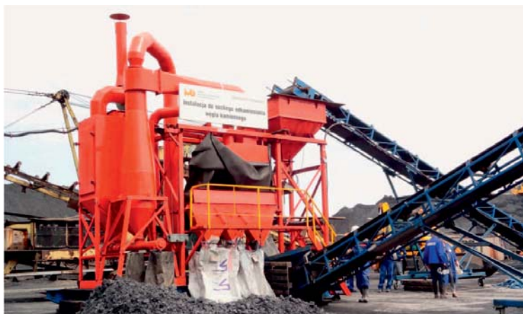
Rys. 2. Instalacja typu FGX-1 do suchego odkamieniania węgla kamiennego

Firma Tangshan Shenzou Machinery Co Ltd. produkuje serię dziesięciu modeli o wydajności od 10 Mg/h do 480 Mg/h. W świecie w takich krajach jak Chiny, USA, RPA, Indie, Australia, Indonezja, Mongolia i Turcja pracuje obecnie łącznie już ponad 1500 sztuk tego typu urządzeń o różnej wydajności. Instytut zakupił model FGX-1 o najniższej wydajności (10 Mg/h), przeznaczając go do badań ćwierć- i półprzemysłowych odkamieniania urobku węglowego z krajowych kopalń. Rysunek 2 przedstawia zakupioną przez Instytut instalację do suchego odkamieniania typu FGX-1 (Prospekt firmy... 2013).