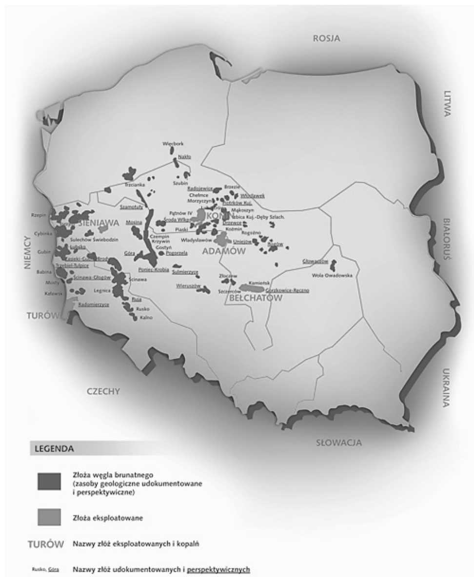
Rys. 1. Występowanie złóż węgla brunatnego w Polsce (Kasztelewicz i Sikora 2012)